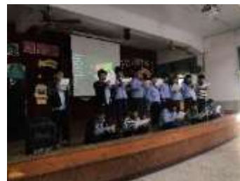
校內英語朗讀成果發表