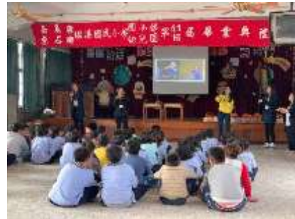
澳洲留學生至校進行英語教學