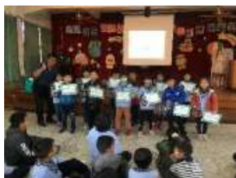
獎勵參與玉山英文營隊表現績優 學生