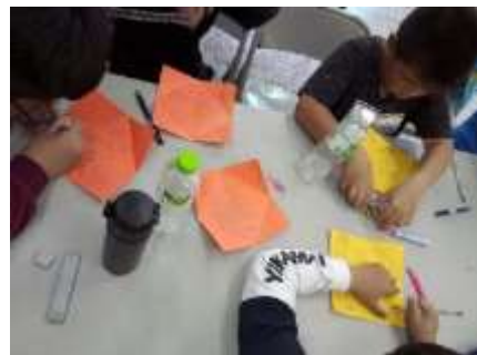
玉山英語營學生成果 3-聖誕卡 集錦