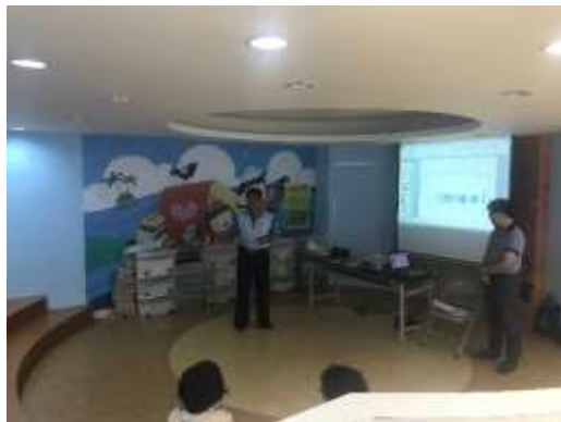
英語教學與課程規劃進修