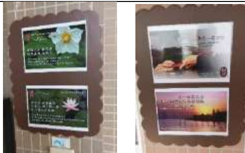
玉山英語營低年級班-聖誕彩繪 成果 2