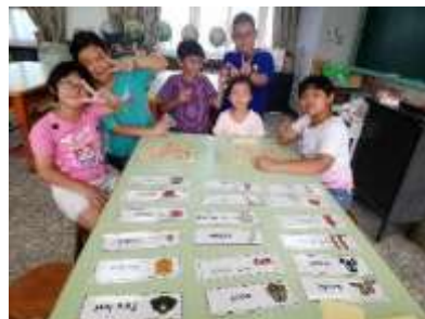
結合防災議題，進行英語教學遊 戲 1