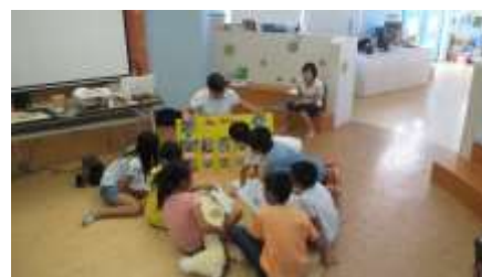
生態英語營學生在認識在地植物及英語名稱