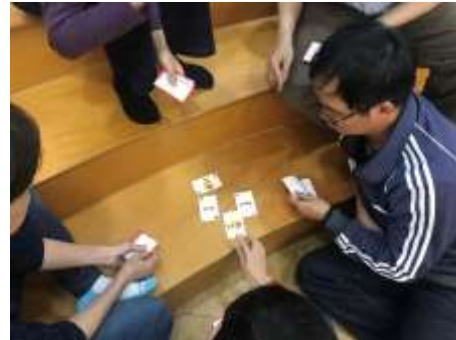
英語教學桌遊進修