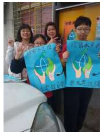
台美生態學校一學生至社區進行 節能愛地球宣導活動結合生態英 語教學。