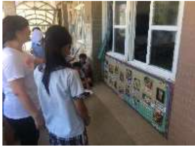
推動主題牆英語教學活動