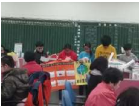
台美生態學校一學生節能愛地球 宣導，結合生態英語教學。