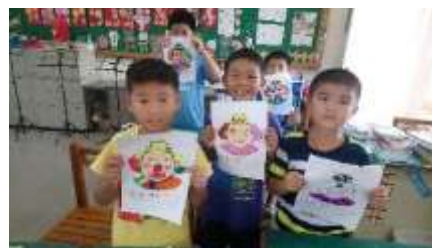
辦理夏日樂學英語營