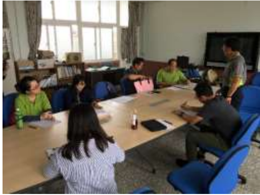
英語輔導團至校分享績優教學策略