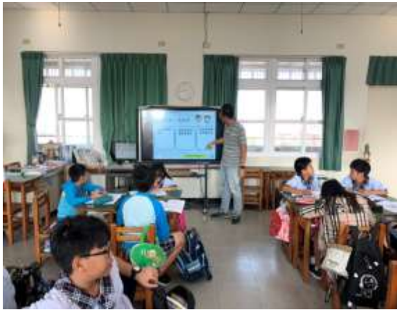
照片說明：食的健康-健康體位教學