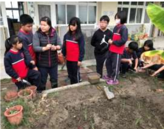
說明：推動食安食農食育小學堂蔬果栽植教學。