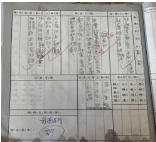
照片說明：透過聯絡簿增進親師溝通並請學生自我反省食的健康-健康體位教學。