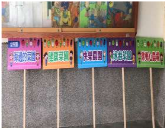
說明：食農教育食材園圃-班級認養菜園標示牌。