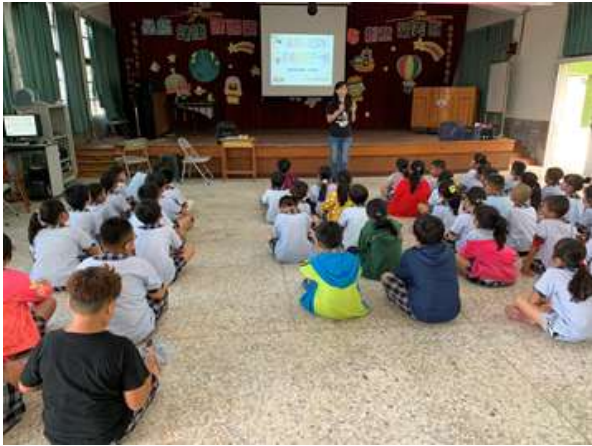
照片說明：彩虹蔬果 579 講座