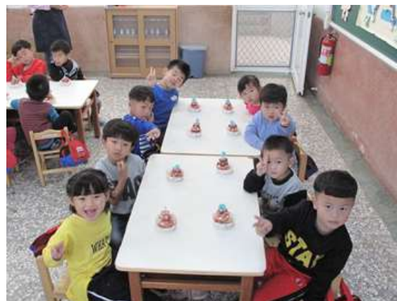
照片說明：推動食安食農食育小學堂計畫-歡樂耶誕草莓薑餅屋 DIY 手作課程。