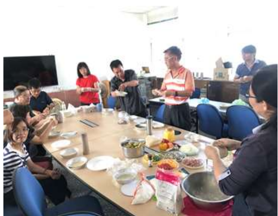
照片說明：當季蔬果在地食材 DIY 手作料理課程-實作課程