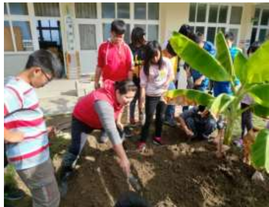
說明：推動食安食農食育小學堂蔬果栽植教學。