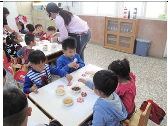
照片說明：推動食安食農食育小學堂計畫-歡樂耶誕草莓薑餅屋 DIY 手作課程。