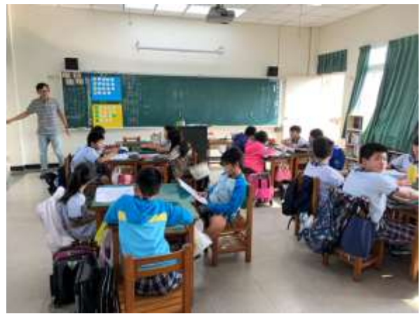
照片說明：食的健康-健康體位教學