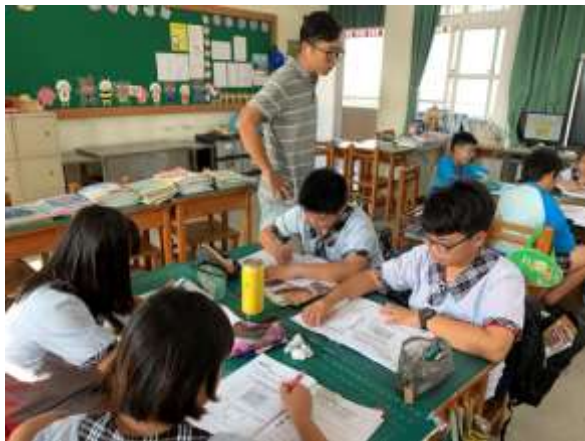
照片說明：食的健康-健康體位教學