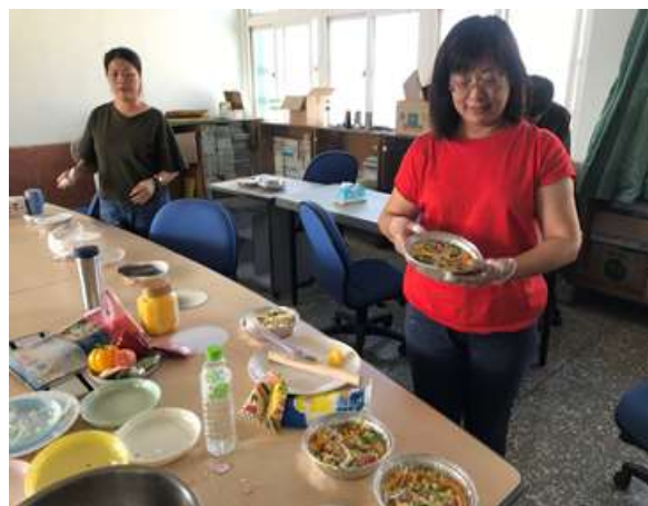
照片說明：當季蔬果在地食材 DIY 手作料理課程-實作課程