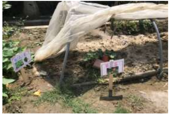
說明：食農教育食材園圃-蔬果植栽標示牌。