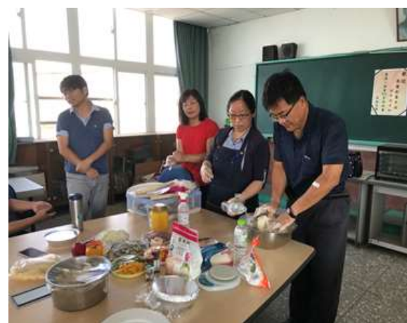
照片說明：當季蔬果在地食材 DIY 手作料理課程-實作課程