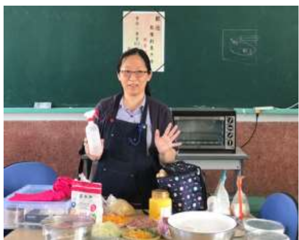
照片說明：當季蔬果在地食材 DIY 手作料理課程-課程介紹