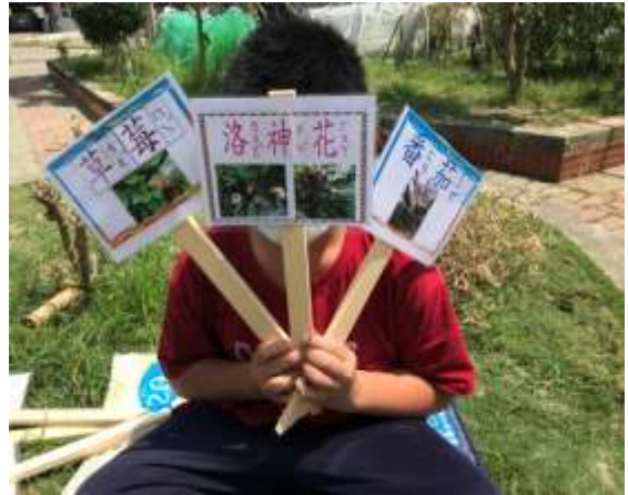
說明：食農教育食材園圃-蔬果植栽標示牌。