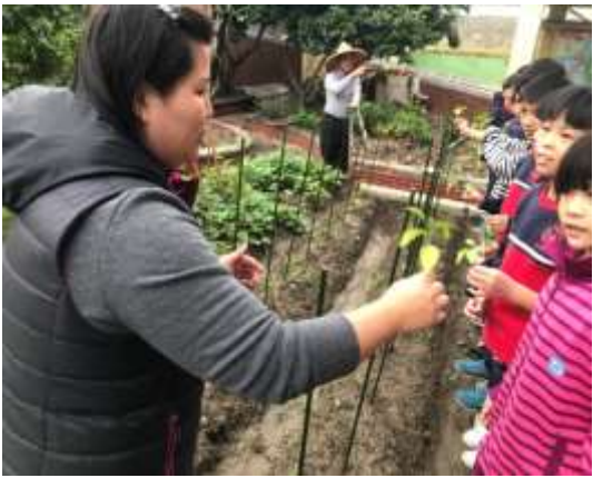
說明：推動食安食農食育小學堂蔬果栽植教學