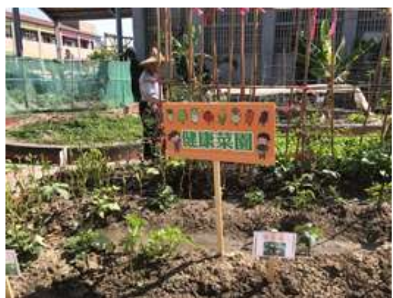
說明：食農教育食材園圃-班級認養菜園標示牌。