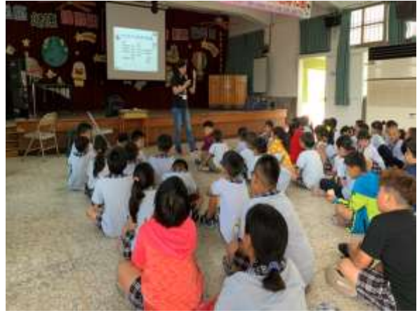
照片說明：彩虹蔬果 579 講座