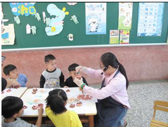
照片說明：推動食安食農食育小學堂計畫-歡樂耶誕草莓薑餅屋 DIY 手作課程。