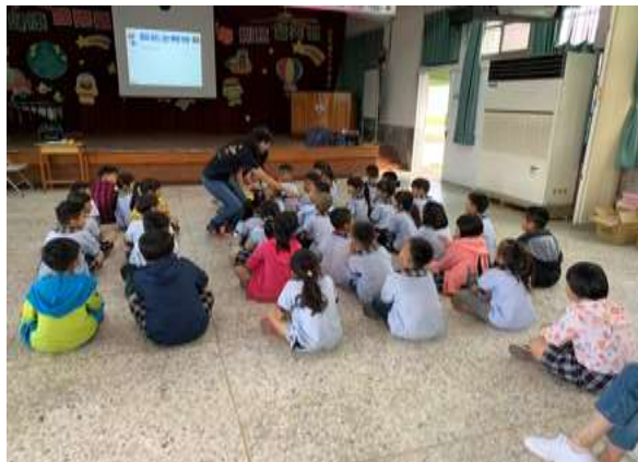
照片說明：彩虹蔬果 579 講座-有獎徵答