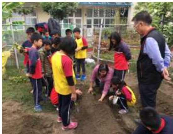
說明：推動食安食農食育小學堂蔬果栽植教學。