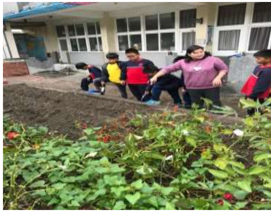
說明：推動食安食農食育小學堂蔬果栽植教學