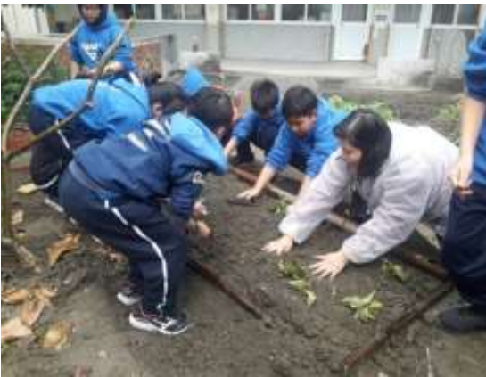
說明：推動食安食農食育小學堂蔬果栽植教學。