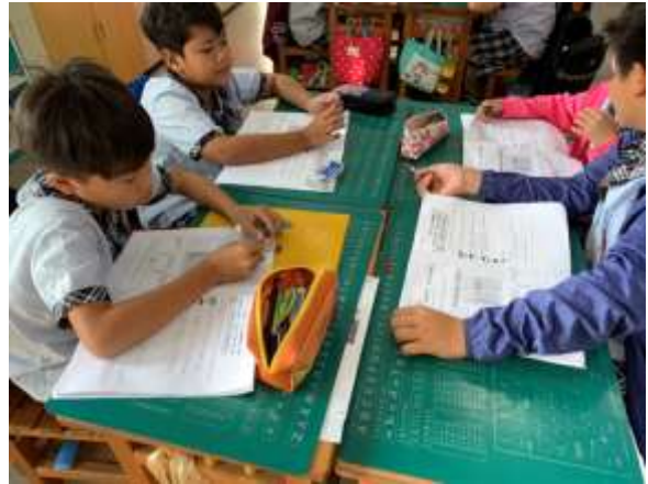
照片說明：食的健康-健康體位教學