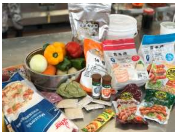
照片說明：當季蔬果在地食材 DIY 手作料理課程-食材介紹(鮮蚵、彩椒、馬鈴薯、地瓜等等)