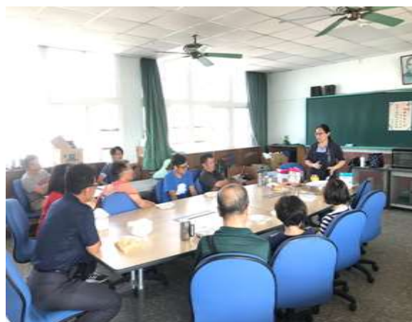
照片說明：當季蔬果在地食材 DIY 手作料理課程-課程介紹