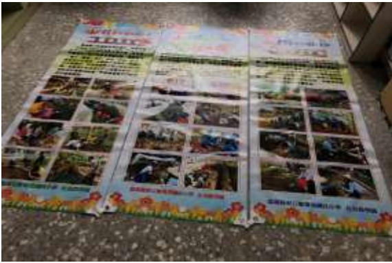
說明：食農教育食材園圃-帆布輸出成果展示。