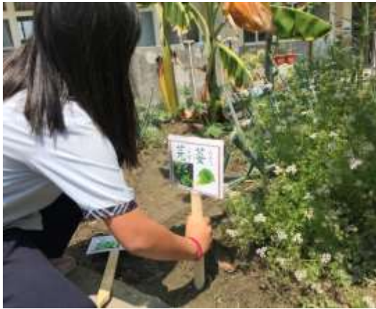
說明：食農教育食材園圃-蔬果植栽標示牌。