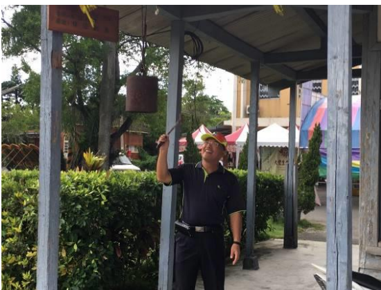
校長為小火車起行敲鐘