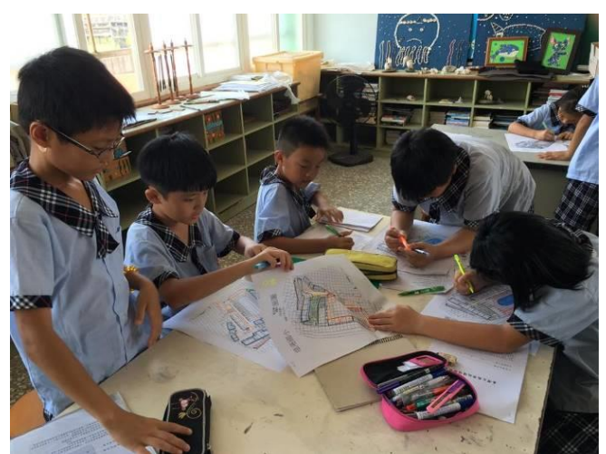
學生計算校園土地使用比