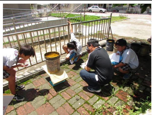
檢視廢棄物-廚餘量