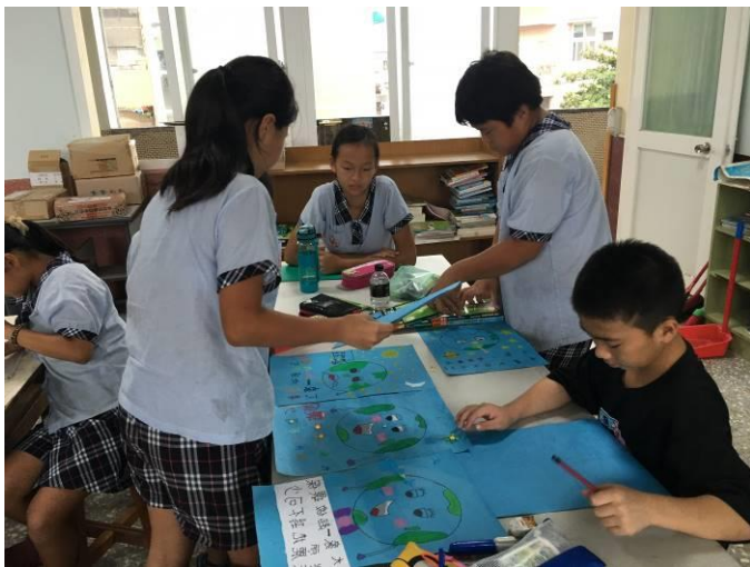
學生製作宣導海報