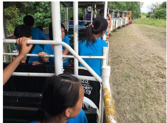
坐小火車聽糖廠的歷史